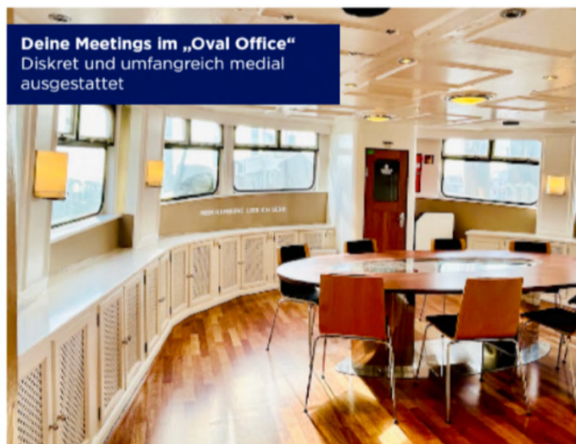
Deine Meetings im „Oval Office“ Diskret und umfangreich medial ausgestattet