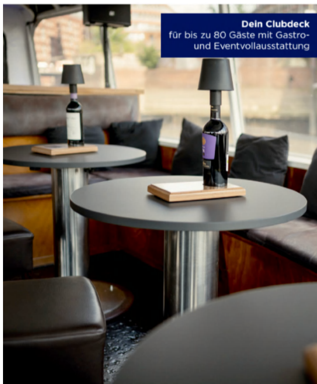
Dein Clubdeck für bis zu 80 Gäste mit Gastro- und Eventvollausstattung