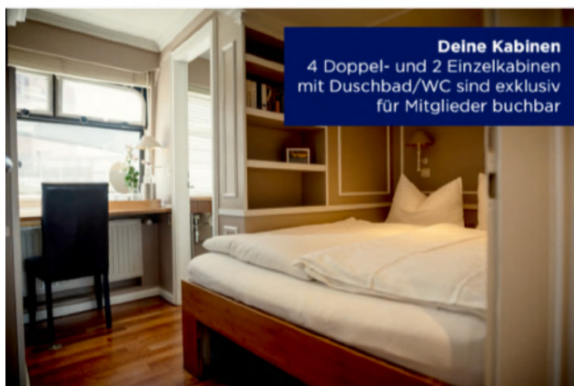
Deine Kabinen 4 Doppel- und 2 Einzelkabinen mit Duschbad/WC sind exklusiv für Mitglieder buchbar